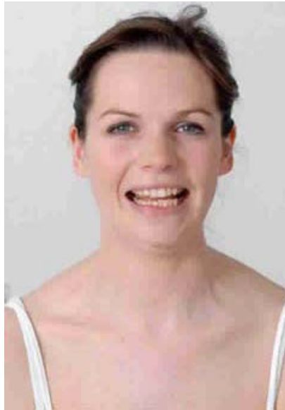
Figure 8.5: Examen de la branche marginale de la mandibule des nerfs faciaux : “Montrez-moi vos dents”