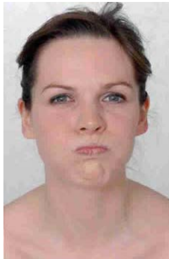
Figure 8.4: Examen de la branche buccale des nerfs faciaux : “Gonflez-vous les joues”